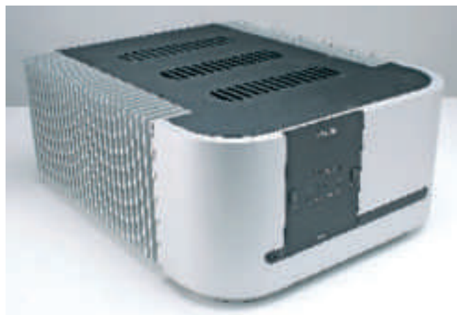
Il finale CA5200 è un 5X200W su 8 ohm, ed è costruito interamente con profilati in alluminio di grande spessore. In grado di accettare sia ingressi bilanciati che sbilanciati, è uno dei finali multicanale più potenti in commercio.

o sbilanciati e digitale ottico, mentre la parte video è completa di out composito, SVideo e component con conversione dei segnali video da e verso ogni tipologia. Molte sono le funzioni speciali possibili con questa macchina, tra cui la presenza di uscita sia audio che video per altre zone dell'appartamento, i molti effetti DSP e un microfono a corredo in grado di effettuare la taratura della macchina sia in fatto di livello che di ritardo dei diffusori. Il telecomando fornito con l'SSP-600 è splendido e molto originale -del resto, non potrebbe essere altrimenti- nelle forme ed è anche particolarmente ergonomico. Uno sguardo all'interno della macchina Classè denota una costruzione che ha dell'incredibile, e che probabilmente mai si era vista in un apparecchio del genere. Gli stati di alimentazione, per esempio, sono tre: due formati da trasformatori toroidali costruiti su specifiche, e un terzo, per le sezioni digitali, da un alimentatore switching. Ogni stadio, sia audio che video, ha una sua